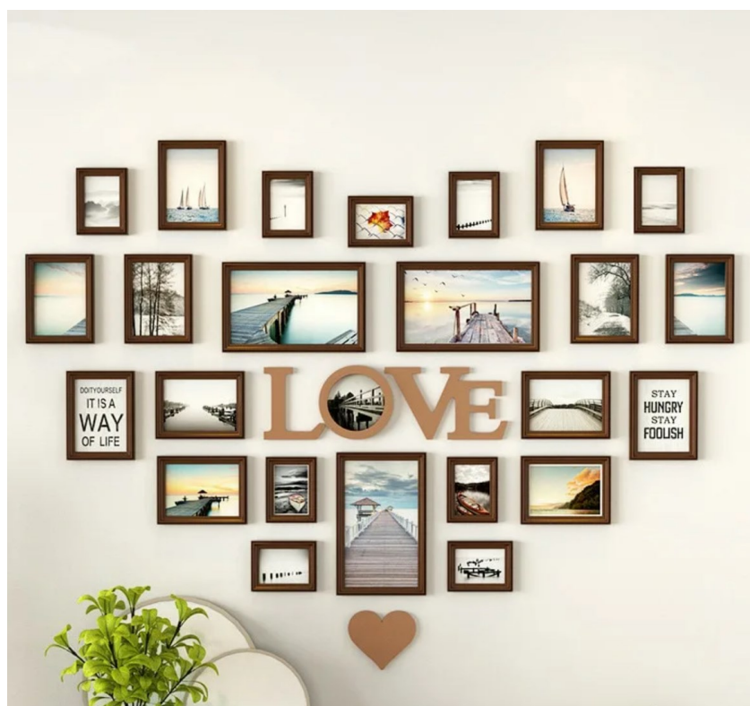
Уголок школьного памяти, где размещаются фотографии школьников прошлых выпусков

https://snabimport.ru/product/naturalnyi_linoleum_forbo_marmoleum_modular-t3362_178005.html