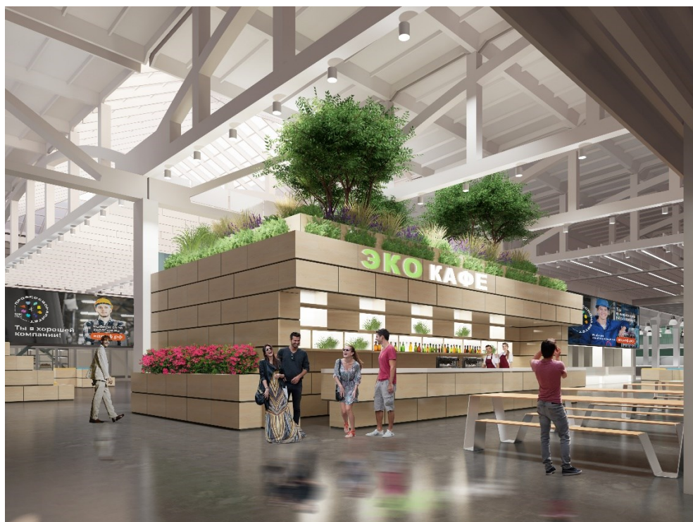
Зеленые растения интегрируются в амфитеатр