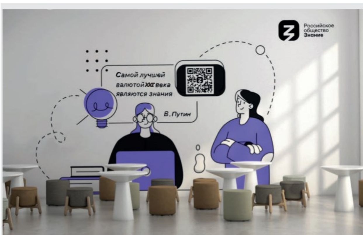
Графическая видовая композиция напротив амфитеатра с отдельными посадочными местами

https://uo-kuragino.ru/upload/files/2023/August/f00c1321/2_Instruktsiia_shkol_noie_prostranstvo_100723_1_.pdf