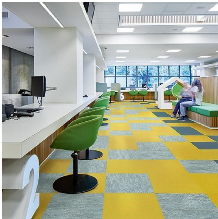
Разноцветный плитный линолеум

https://snabimport.ru/product/naturalnyi_linoleum_forbo_marmoleum_modular-t3362_178005.html