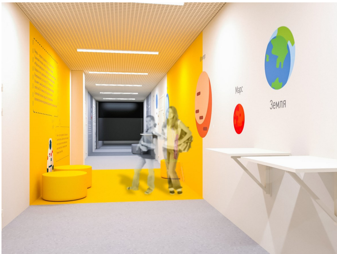
Крупные графические изображения, мебель в цвет цветных пятен